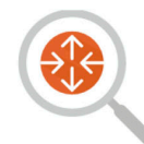
Redes & Comunicaciones