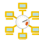
Simulación de Tráfico