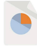
Diagnóstico & Recomendaciones

Los informes de diagnóstico y recomendaciones de TI Health Check ayudan a identificar los problemas existentes o potenciales así como genera oportunidades que permiten optimizar su red, centro de datos, comunicaciones unificadas y entornos de nube.