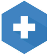
Instalación del Colector