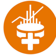
Análisis & Correlación